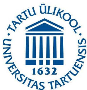
Нарвский колледж Тартуского университета