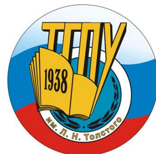
Тульский государственный педагогический университет им. Л.Н. Толстого