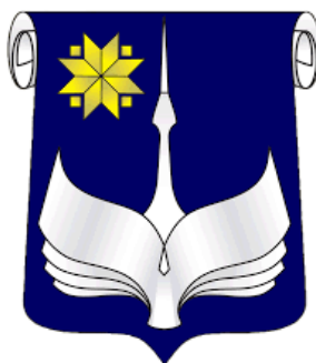
Барановичский государственный университет